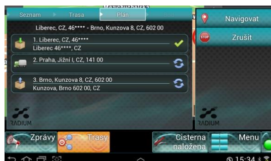
Detail aplikace FleetwareOnBoard – itinerář trasy

Úzce spolupracujeme se společností Sygic, osvědčeným výrobcem špičkového navigačního SW.