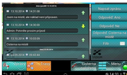
Detail aplikace – Textové zprávy